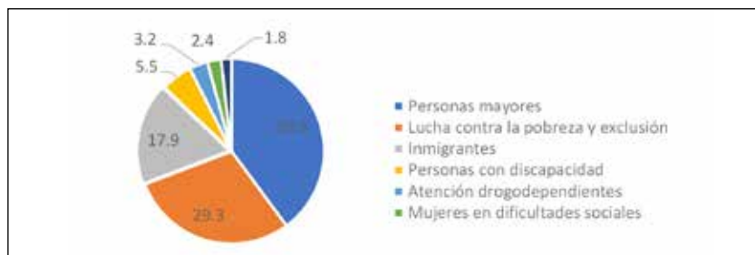
Figura 2. Composición general del colectivo vulnerable.

En primer lugar, mostramos una visión global de la población que de alguna marea se sitúa en situación de riesgo: