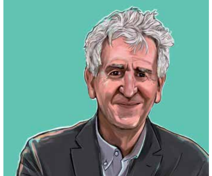
Juan Luis Arsuaga Codirector d’Atapuerca

Les crisis són moments de canvi per les mateixes raons que poden ser-ho de conservació o de reculada. Que ens decidim per l’una o l’altra és quelcom que no ens ensenya cap manual, sinó que depèn de les decisions que adoptem. Podria passar que un món s’hagués acabat i que el continuéssim pensant amb categories d’un altre temps i gestionant-lo com si res hagués passat. L’espècie humana deu la seva supervivència a la intel·ligència adaptativa, compatible amb què en molts aspectes seguim instintivament aferrats al que fins ara havia funcionat. En aquest cas caminariem com a zombis enmig de seriosos advertiments que no ens acabem de prendre prou seriosament, com si la situació natural de l’ésser humà fos la distracció i la societat el lloc en el qual es realitza aquesta enorme distracció col·lectiva.