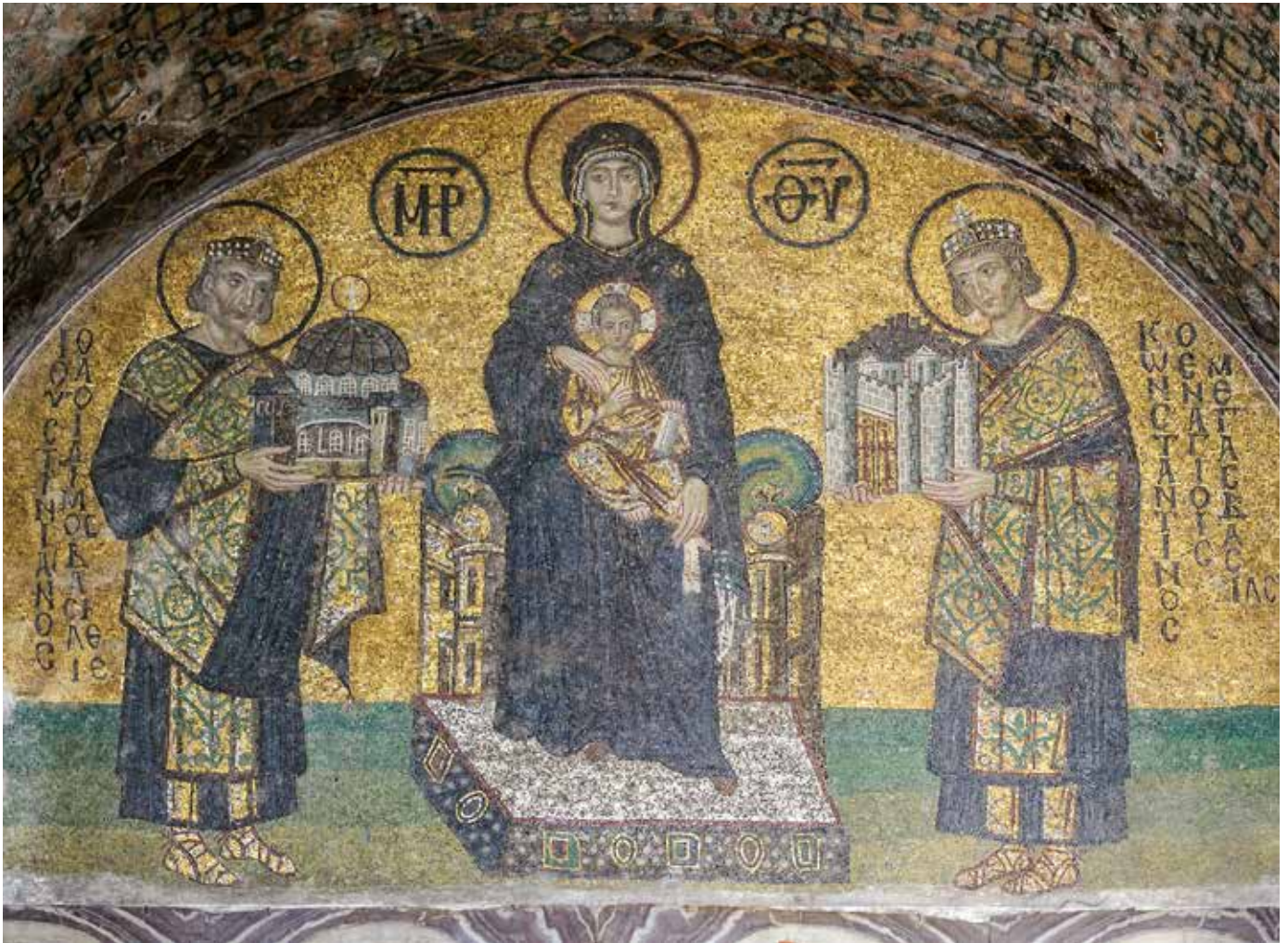
Mosaics de l'entrada meridional del nàrtex. Constantí (dreta) i Justinià (esquerra) presentant les seves ofrenes –la ciutat i Hagia Sophia– a la Verge amb el Nen.

da, data del 1118 i mostra Joan II Comnè († 1143) i l'emperadriu Irene († 1133) a cada costat de la Theotokos . A aquests mosaics s'han d'afegir pintures com la del 1122, que representa l'emperador Comnè Aleix I († 1118) sobre una pilastra o la d'Alexandre III († 1203) de la galeria nord. No obstant, el mosaic més conegut i el de més qualitat representa una majestuosa Dèisis (Jesucrist, la Verge i sant Joan Baptista), i correspon ja al segle XIII.