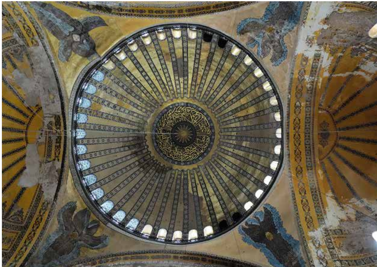
Cúpula central amb els seus imponents 31,87 m de diàmetre.

Els quatre minarets de l'exterior, els mausoleus edificats al voltant de l'església, els sis medallons a l'interior (de 7,5 m de diàmetre) amb inscripcions en àrab (amb els noms d'Al·là,