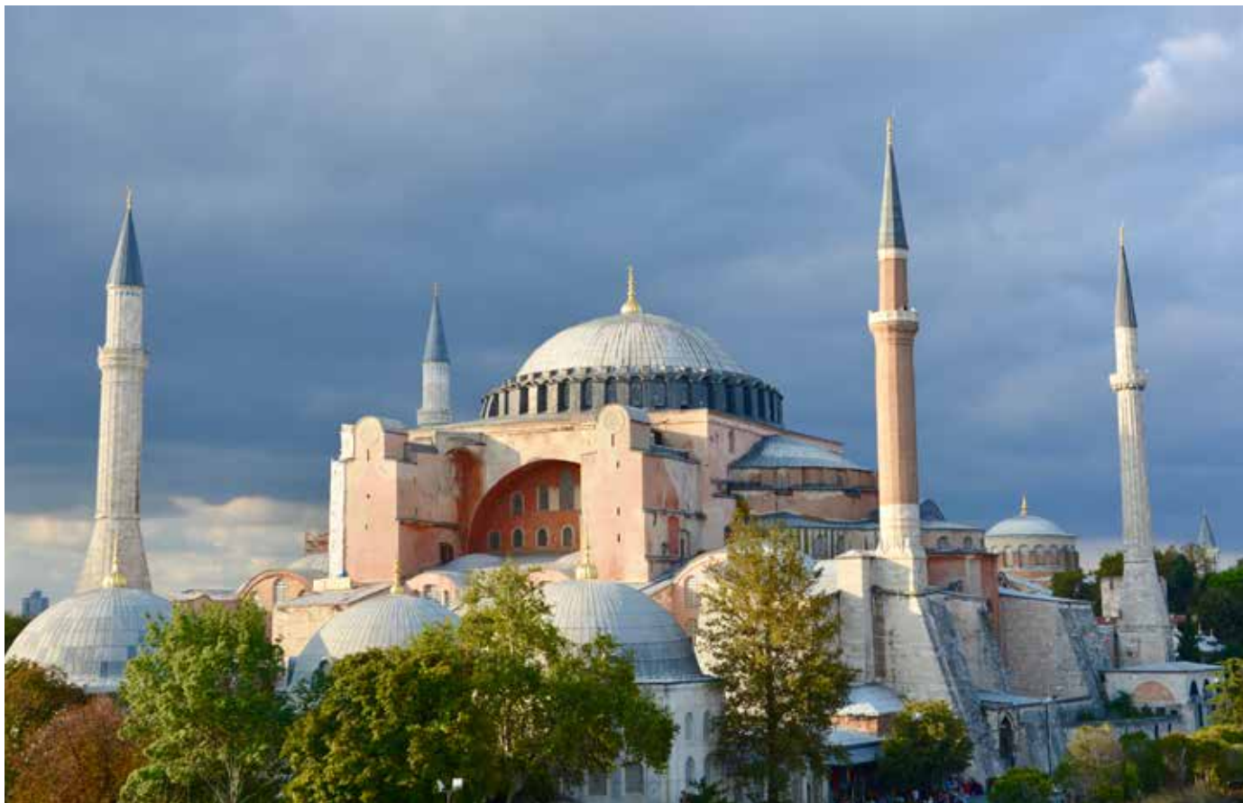
Exterior de Santa Sofia, 15 segles després de la seva construcció.

cúpula sobre una base gairebé quadrada, cúpula que, per la seva audàcia i impacte visual, es va constituir com un referent per a l'arquitectura no només bizantina, sinó també mundial. L'Imperi romà d'Orient mai no havia tingut un edifici amb un espai tan imponent.