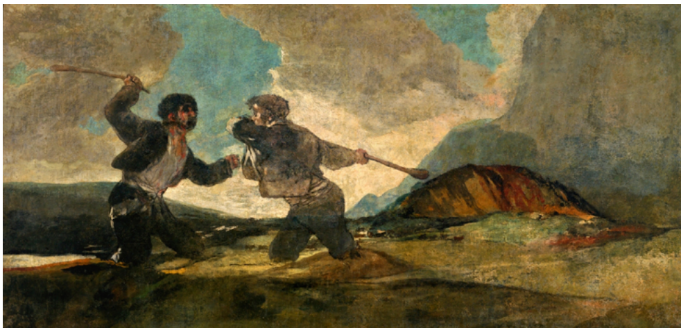
Duelo a garrotazos (1819), de Francisco de Goya.

A pesar de todo ello, el proceso civilizador del que nos habla Norbert Elias parece que se va haciendo evidente con el transcurso de los siglos.