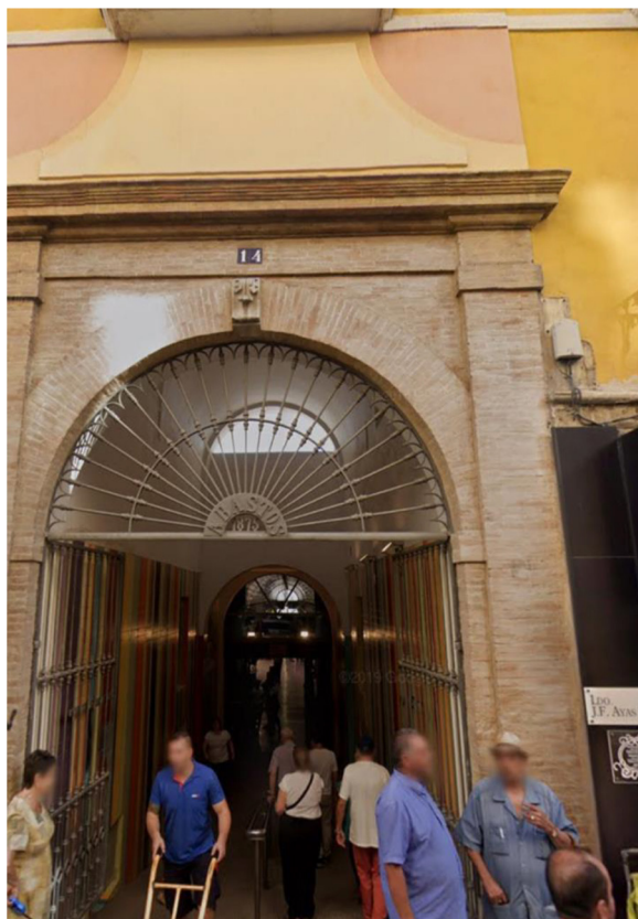
Fachada principal del mercado de abastos de San Francisco (1873), c/ Álamos, 10. Jaén. Se construye, tras la desamortización, en las huertas del convento de San Francisco, del que toma su nombre.

se encuentra en la historia que ha determinado y diferenciado a lo largo de los años, los contrastes morfológicos, las distintas unidades de paisaje y los elementos de interpretación de la interacción social, ya que el espacio urbano (histórico)cultural de la ciudad no es solo un espacio simbólico (conceptual), sino que es un espacio vivo (real).