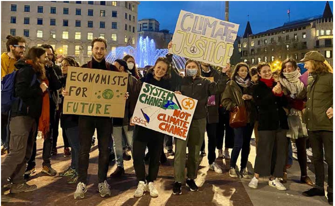
El moviment Fridays For Future recorda la lluita contra el canvi climàtic des del cor de Barcelona | Karina Jacome

cobertes, com els polígons industrials, i arribar més i millor a tots els racons del territori avançant cap a sistemes de transports d'emissió zero.