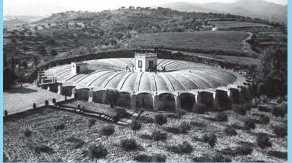
Fotografia de la coberta: Dipòsit de Can Boada, 05/08/1966.